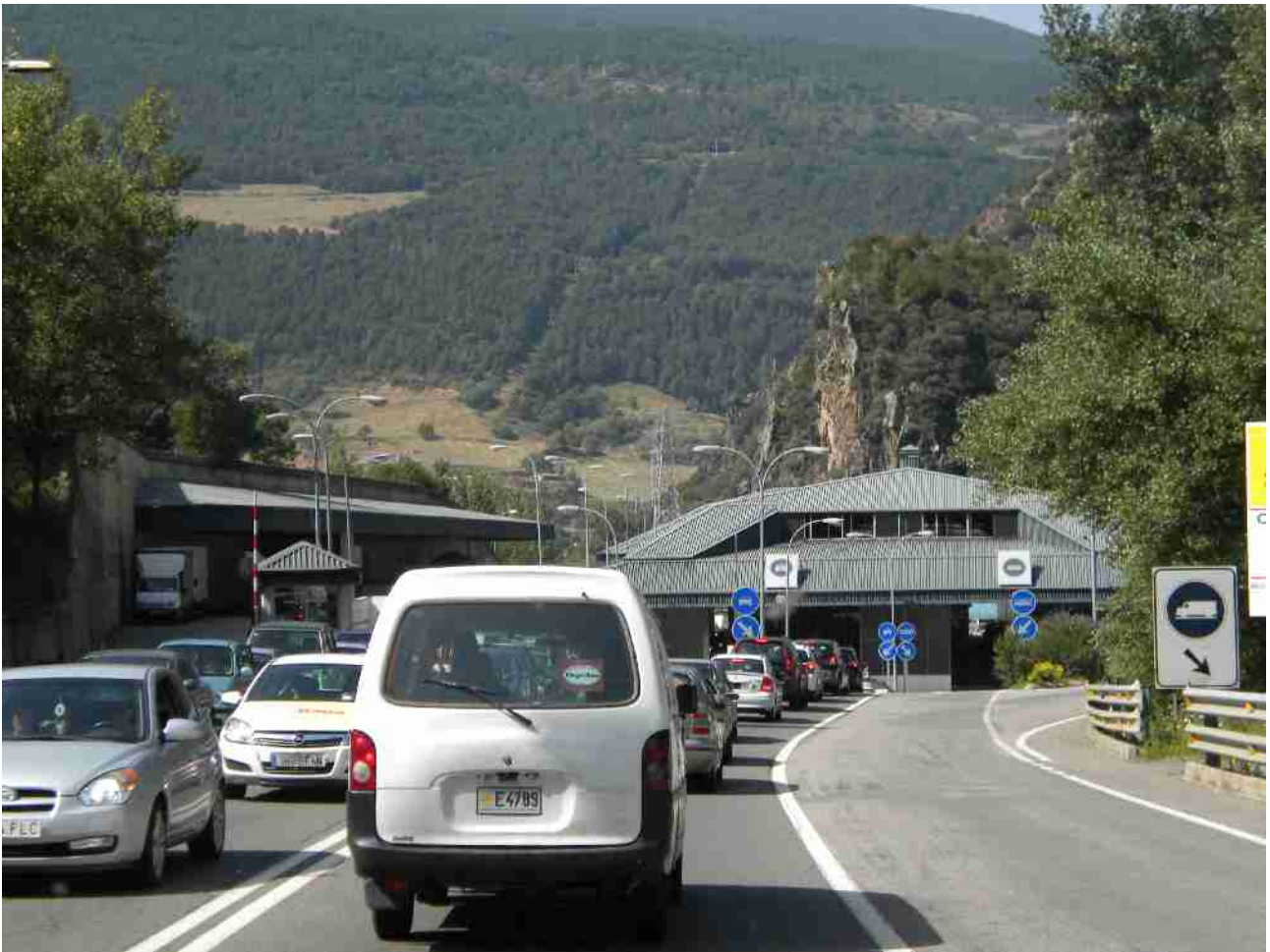
Continuamos assim ate nuevalos ,fomos visitar o Mosterio de Montserrat